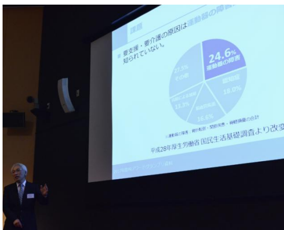
〈プレゼンテーションをする大江委員長〉

注釈)ロコモティブシンドローム(略称ロコモ)・・・運動器の障害のため移動機能の低下をきたした状態。進行すると介護が必要になるリスクが高くなります。